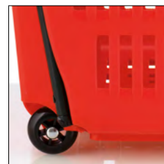
Ruedas de 50mm fijas. 50 mm fixed wheels.