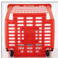
Base reforzada. Reinforced base.