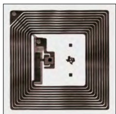
Distintos sistemas antirrobo. Different anti-theft systems.