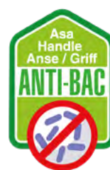
Asa Antibacteriana. Antibacterial handle.