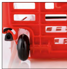
Ejes protegidos. Protected shafts.